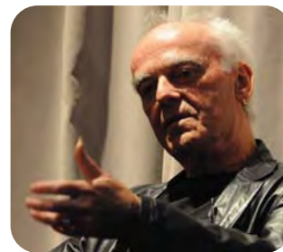
Jürgen Klauke

Als junger Avantgarde-Künstler erkannte Jürgen Klauke bereits in den 1970er Jahren die Pionierrolle der Fotografie in der Bildenden Kunst, die seinerzeit noch nicht als Kunstform anerkannt war. Er schrieb damit Geschichte und nahm nachhaltigen Einfluss auf die nachfolgende Künstlergeneration. Jürgen Klauke ist kein Fotograf, sondern ein Künstler, der die Fotografie als Instrument benutzt, um sich und die Welt zu befragen. Klaukes Werke sind in etlichen Sammlungen vertreten; er wurde mit zahlreichen Preisen und Auszeichnungen geehrt und in großen Museen national und international gezeigt. Im Gespräch mit Prof. Dr. Stephan Berg, seit 2008 Direktor des Bonner Kunstmuseums und mit dem Werk Klaukes seit vielen Jahren vertraut, wurden Bedeutung und Einfluss dieses Künstlers auf die Fotografie als Inszenierung und Kunstform deutlich.