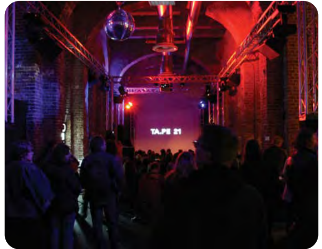
TAPE21, Foto: Christine Roskopf

Die KunstSalon-Stiftung unterstützte am 31. Oktober Tanz- und Performancekunst im Rahmen der Kunstmesse ART-FAIR 21 in Köln. TA.PE 21 erweiterte die Perspektive auf die Bildende Kunst um eine faszinierende Komponente: eine bewegte Dreidimensionalität – ein räumliches Bild, das sich in immer neuen Variationen verändert. TA.PE 21 stellte einen einzigartigen Zusammenschitt der in Köln vertretenen Darstellenden Szene vor. Sechs Ensembles zeigten in einer sechsstündigen Gesamtinszenierung Ausschnitte, Anschnitte und Inszenierungen aus dem Bereich Tanz und Performance, einen außergewöhnlichen Wechsel spannungsgeladener und faszinierender Darbietungen. Kuratiert und geleitet wurde TA.PE 21 von Maika Paetzold.